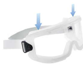
ELATPR2 &amp; ELATPRS