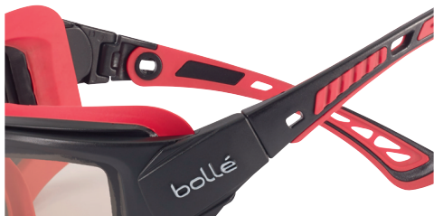
傾き調整可能テンブル

※ 上記は弊社試験所調べによるものです。 いかなる環境下で上記通りの効果・性能をお約束するものではありません。